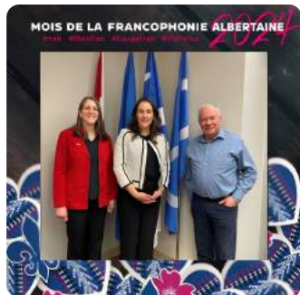
Rencontre avec la députée Janet Eremenko