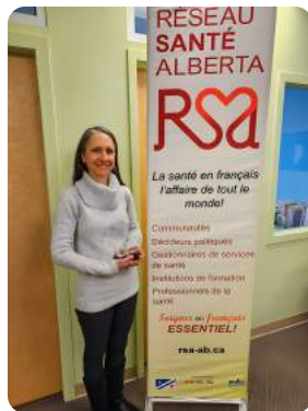
Présentation aux étudiants en médecine parlant français