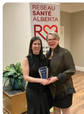
Gala francophone reconnaissance