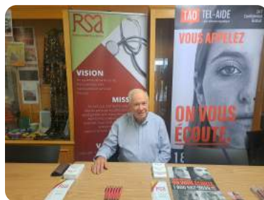
Journée d'accueil des étudiants